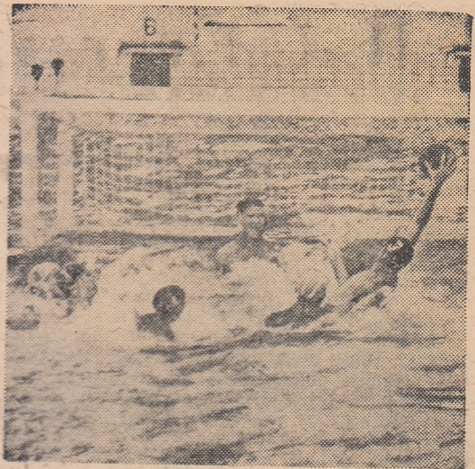
Covaci a reluat imparabil în poarta lui Mureșan și Steaua conduce cu 2-0. Fază din meciul Steaua — Crișul.

Cele două meciuri programate la Timișoara și Arad nu s-au disputat. Progresul București a întârziat cu 50 de minute la jocul cu Ind. linei, iar Mureșul nu s-a prezentat la Arad (!). Astăzi (bazinul Dinamo de la ora 11) sînt programate două partide: Steaua — Voința Cluj și Dinamo — Rapid.