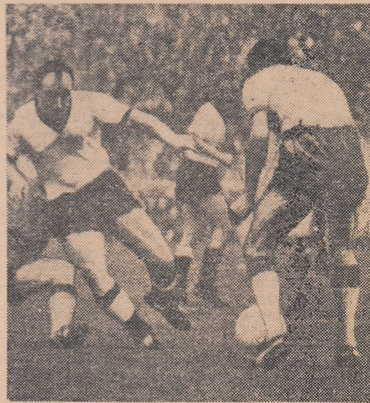
Uwe Seeler (stînga), cunoscutul atacant central de la S. V. Hamburg într-o atitudine caracteristică

În ce sistem va juca echipa vest-germană? Să-i cităm din nou pe Helmut Schön: „Not ne adaptăm totdeauna jocul în funcție de adver-