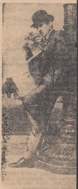
ȘTIȚI cine este acest tîleman postat în Place Concorde din Paris Cîr teste ziarul „Sunday Times” Nu este un turist englez portarul reprezentativei fete, Marcel Aubour. De acum el se acomodează ambianța londoneză. În mul pe care echipa sa făcut în preliminarii spre meciul final, Aubour și-a pletat garderoba în „stîglez”. După victoria în fața asupra Norvegiei la Oslo, Aubour și-a cumpărat o englezească, iar după meciul pierdut în fața echipei iugoslave și-a luat un tricou și cel mai fînt pantof glez... Acimizarea gata!

DE CURIND, cunoscutul internațional al echipei de polo a Ungariei, György Karpáti, în vîrstă de 31 de ani, a fost sărbătorit pentru cea de a 150-a selecționare în reprezentativa țării. În cei 15 ani de activitate internațională, Karpáti a participat la patru ediții ale J.O. și la trei campionate europene. Jucînd în reprezentativa Ungariei, Karpáti deține trei medalii olimpice de aur și tot atîtea de campion al Europei. Acum, cunoscutul jucător ungur se pregătește pentru J.O. din Mexic și speră să atingă cifra record de 200 de selecționări.