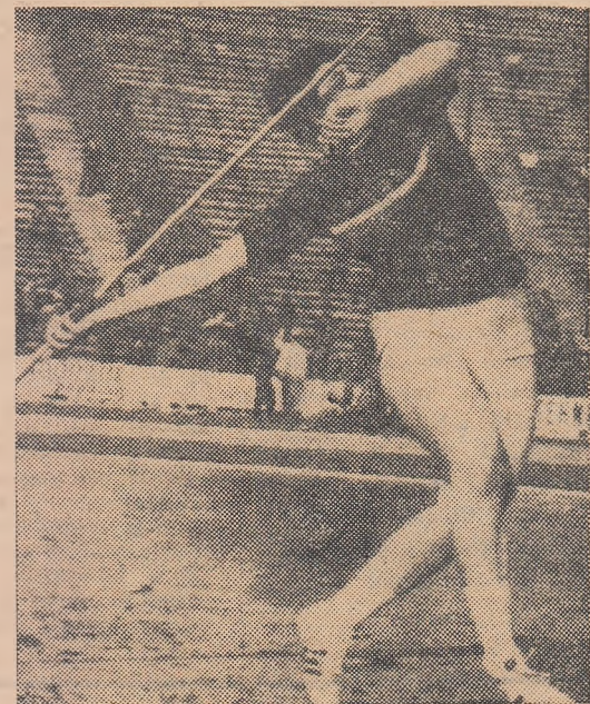
Campioana olimpică Mihaela Peneș în plin elan