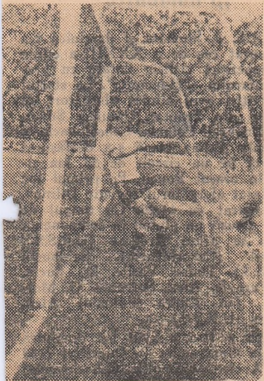
pe care nu l-au putut „prinde” decisiv și Frățilă a rehat balonul

Metalul Copșa Mică — Chimica Tirnăveni 1-0 (0-0) Steaua roșie Salonta — Unirea Dej 1-1 (0-1) Faianța Sighișoara — A. S. Aiud 1-2 (1-2) Progresul Reghin — Forestiera Sighețul Marmăției 2-1 (1-1) Minerul Bihor — Gloria Bistrița 2-0 (1-0) Olimpia Oradea — Minerul Baia Sprie 2-0 (1-0) Sătămăreana — Soda Ocna Mureș 3-2 (2-2)