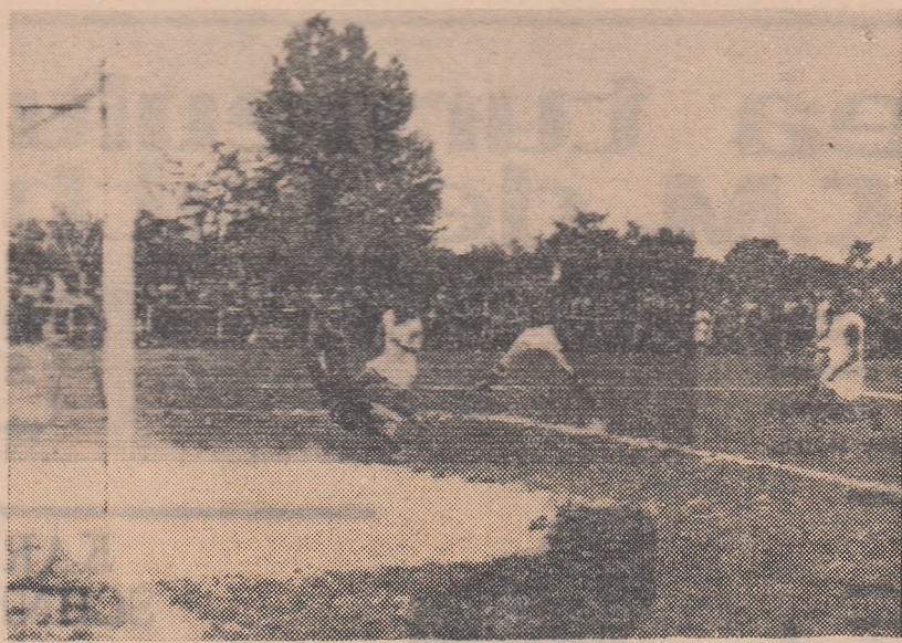
Fază din meciul Steaua roșie Salonta — Unirea Dej (1—1), disputat duminică la Salonta