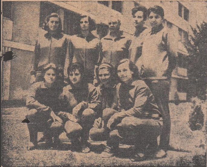
Sportivele noastre după ultimul concurs de verificare.

Anul acesta Uruguay, „echipa celestă”, cum este denumită această formație, se află din nou în turneul final al C. M. și îi revine onoarea ca, împreună cu reprezentativa Angliei, să inaugureze la 11 Iulie, pe stadionul Wembley, marea întrecere a fotbalistilor lumii.