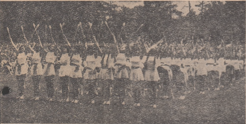
TINERETE, GRATIE, FRUMUSEȚE Citiți în pagina a II-a reportajul nostru de la tradiționala serbare a elevilor din Rm. Vilcea