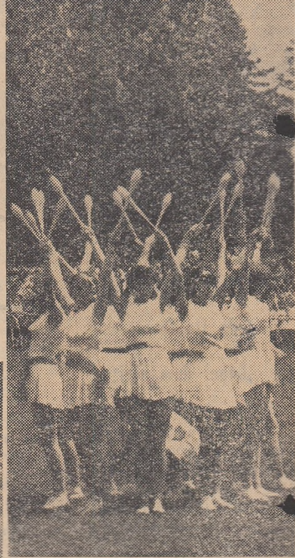
Imagini de la încântătoarea serbare a elevilor din Rm. Vilcea, surprinse de fotoreporterul nostru V. BAGEAC.