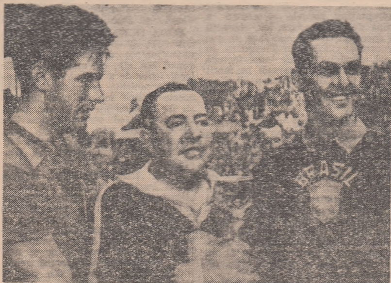
1958: Feola, ținând în mâini „Cupa Jules Rimet”, încadrat de Bellini (stînga) și Gilmar.

3. Va aduce campionatul mondial ceva nou în tehnica și tactica fotbalului?