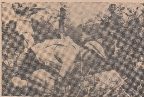
FOSTUL recordman mondial Gordon Pirie, considerat „copilul teribil” al atletismului britanic, după ce a abandonat atletismul s-a... reprofilat, participînd în concursurile de orientare turistică. La cei 35 de ani ai săi, Gordon Pirie a pășit cu dreptul în această nouă disciplină sportivă pe care și-a ales-o. Recent, el a cîștigat campionatul Angliei la orientare turistică.

DEȘI NU este „direct interesat”, Helenio Herrera nu-și va pierde timpul degeaba la Londra, în timpul campionatelor mondiale. El a semnat un contract cu o agenție italiană de presă pentru o serie de reportaje de la C.M., urmînd să primească pentru acestea suma de 5 milioane de lire. Chiar dacă