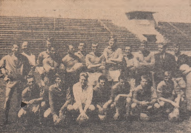
Echipa feroviară a Olandei, fotografiată ieri, înainte de antrenament