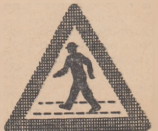
Trecere pentru pietoni