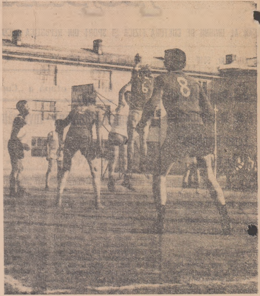
În fotografiile alăturate — aspecte de la întrecerile finale la volei și la jocul marinăresc, disputate în cadrul „Cupei SMT” (Marghita)

La lumina tuburilor cu neon, solcitînd păreri, după întemțirea cla-