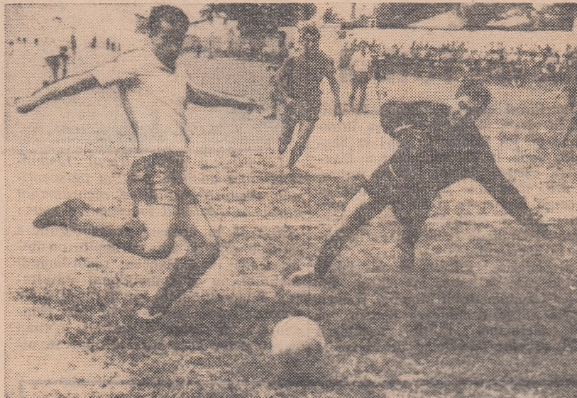
Înaintașul bucureștean (tricou deschis) aflat în careul de 6 m depășește și pe portar și marchează cel de-al doilea gol pentru gazde, dar... (Fază din meciul Flacăra roșie București — Marina Mangalia 2-3)

● VICTORIA ROMAN — METALOSPORT GALAȚI (1-0). O partidă de slabă calitate, presărată cu multe greșeli tehnice și desfășurată într-un