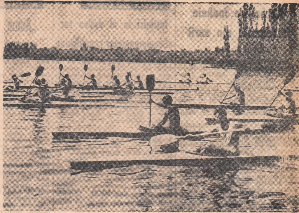
ANTRENAMENT PE HERĂSTRĂU