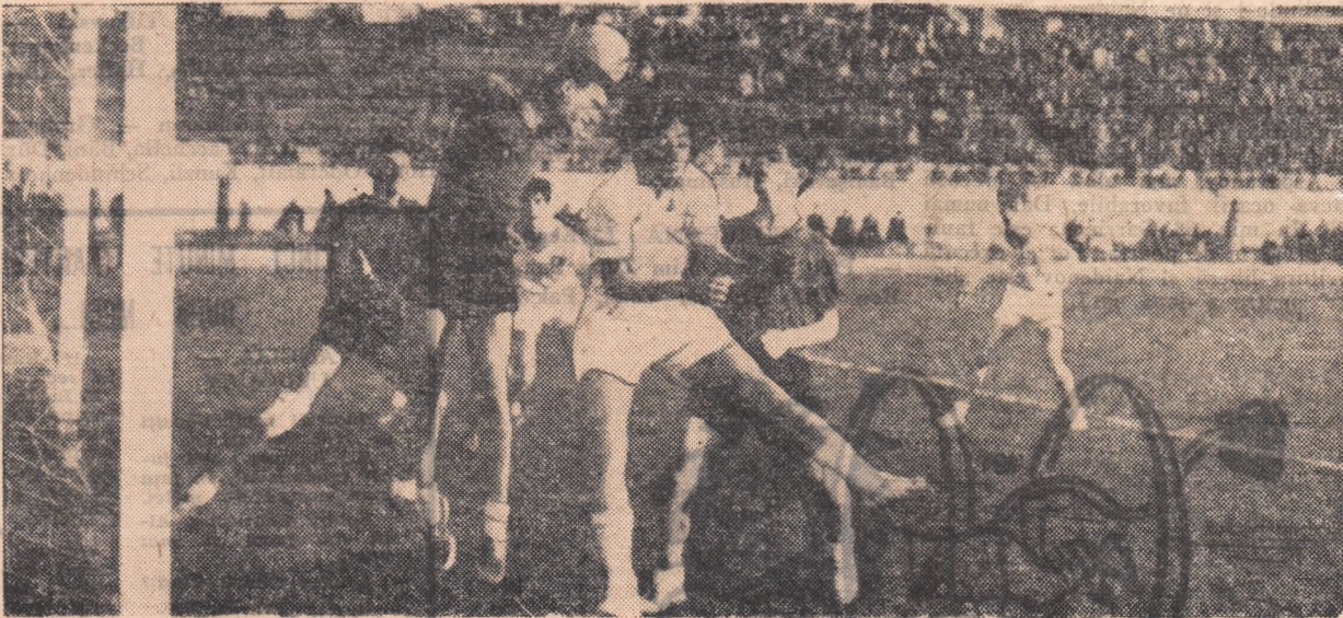
Între o imagine dintr-un meci între echipe școlare, disputat în Capitală