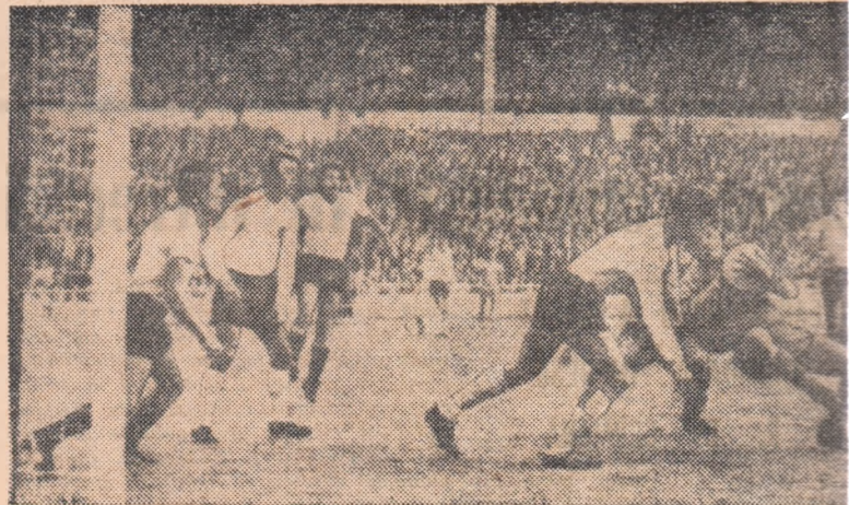
Mare aglomerație în careul uruguayenilor. În repriza secundă gazda au dominat copios dar „betonul” sud-americanilor a fost la înalt. Fază din meciul Anglia-Uruguay 0-0.