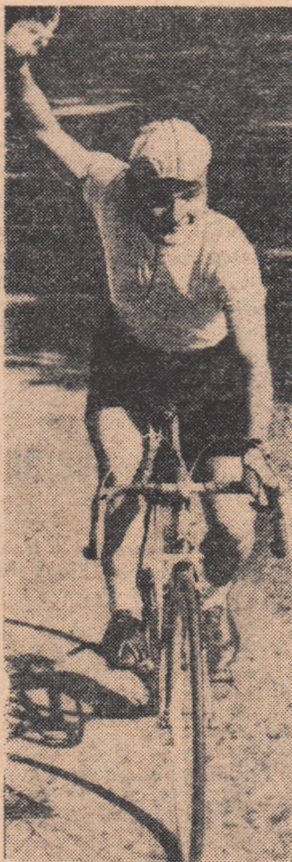
Cițiți amănunte asupra comportării cicliștilor noștri în pag. a 2-a.