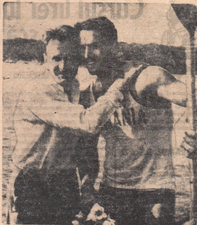
Victorie! Una din multele bucurii...