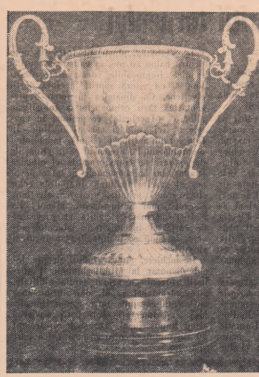
Cupa oferită de ziarul nostru