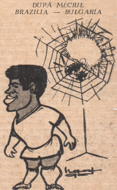
— Asta e Garrincha! Ține-ți minte! Desen de NEAGU RĂDULESCU