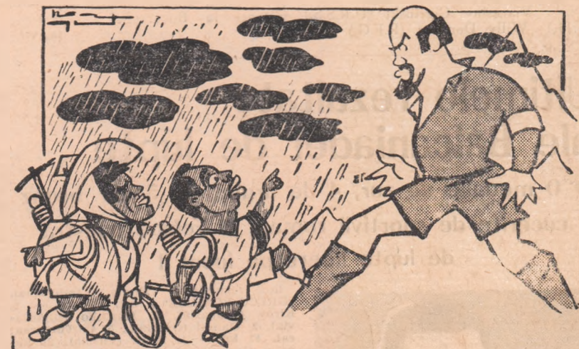
PELE: Garrincha, va trebui să-1 escaladăm de cîteva ori ca să ne putem califica.

— Cum să spun, în general, bune. Nu pot să-ți mulțumesc sută la sută pe toți cei 1 600 de ziaristi sportivi și pe cei 300 de reporteri radio și tele din peste 60 de țări, dar mă străduiesc. La centrul de presă de la Royal Garden Hotel se lucrează fără întrerupere, zi și noapte. Peste 1 100 de linii telefonice,