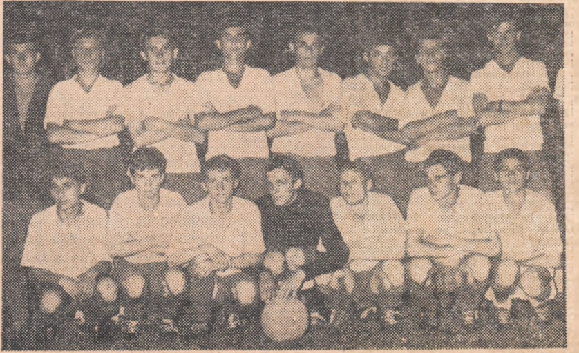
Formația Școlii profesionale R.M.R. Iași surprinsă de fotoreporterul nostru A. Neagu, la cîteva clipe după cîștigarea finalei susținute în compania echipei Școlii profesionale Electromotor Timișoara