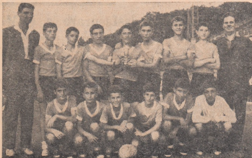
Echipa Școlii generale nr. 27 Galați, cîștigătoare a „Cupei orașelor reședință de regiuni“, suride fericită în fața obiectivului fotografic