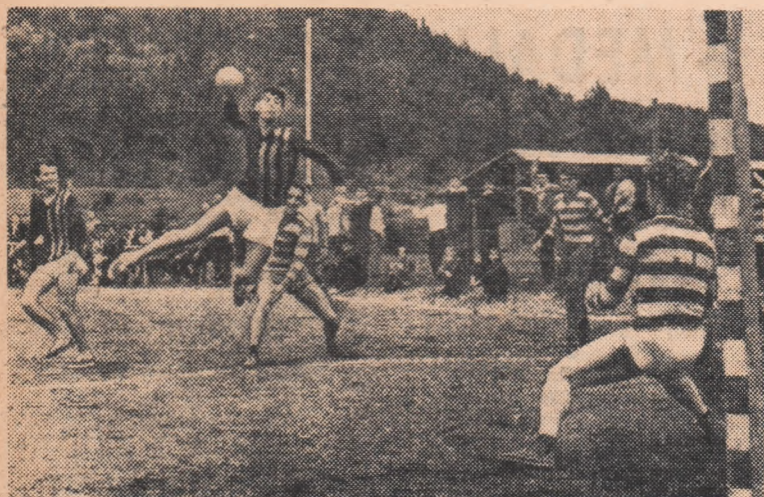
Fază din meciul amical de handbal Gura Humorului — Avintul Frasin. Unul din tinerii componenți ai echipei de handbal de la Gura Humorului trăgînd din săritură la poarta frăsinenilor.

Mai târziu, spre seară, frăsinenii au sărbătorit și un alt eveniment: împlinirea a 20 de ani de la înființarea corului satului. Două aniversări care dovedesc ce posibilități minunate se ivesc atunci cînd sportul și cultura își dau mina.