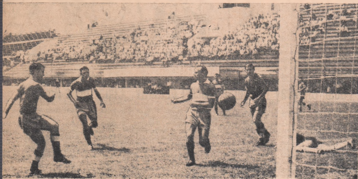
O fază critică la poarta Farului (Rapid — Farul 3—3, prima manșă a finalei „Cupei balcanice“)