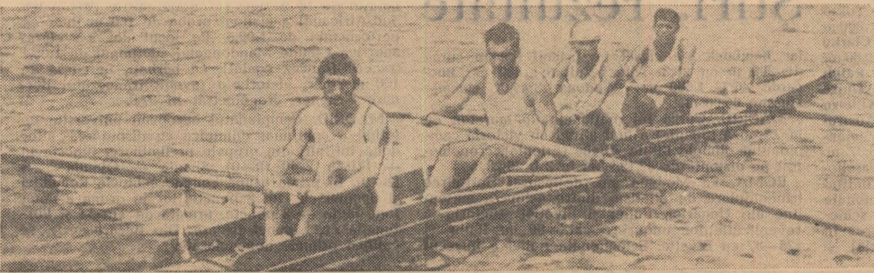
Echipajul dinamovist campion la schif 4 fără cirmaci