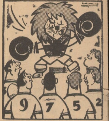
WILLIE: Și nu uitați, dragii mei, că noi am avut și campioni de box ai lumii... Desen de Neagu Rădulescu

SIMBATA, postul de radio B.B.C. a difuzat o dată cu programul în continuare al campionatului mondial de fotbal și un imn special pentru acest campionat. Muzica este compusă pe o temă a compozitorului Edward Elgar scrisă în 1898. Compozitorul, care era un admirator al unei echipe de fotbal engleze, a tri-