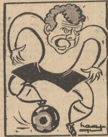
BOBBY MOORE