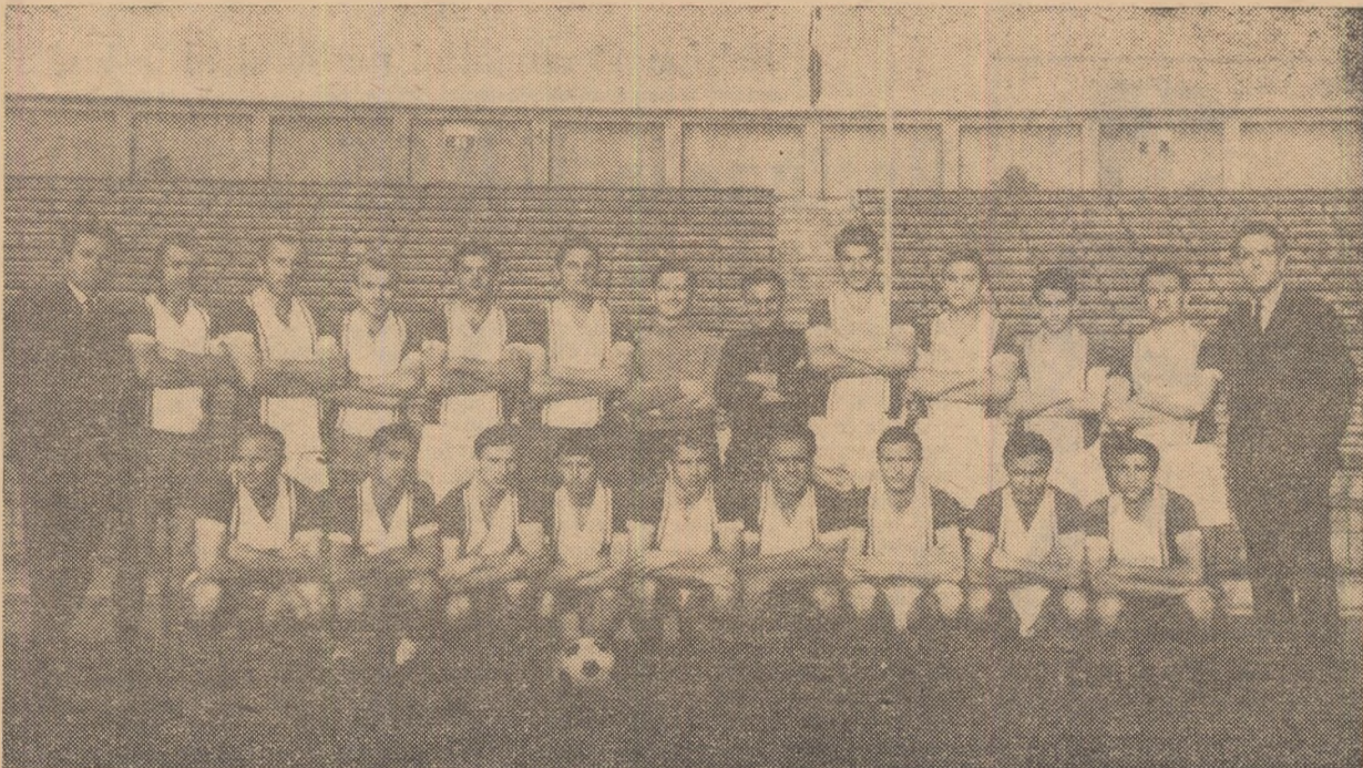
Progresul București, câștigătoarea campionatului categoriei B, seria I

După un an în categoria B, Progresul București revine în primul campionat al țării spre bucuria suporterilor ei și a amatorilor de fotbal din Capitală care vor asista din nou la cuplaje bucureștene.