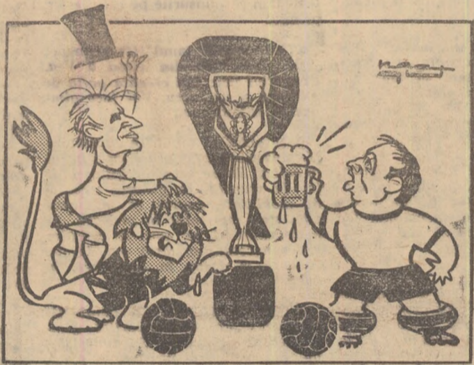
Baby Charlton sau Uwe Seller? Desen de Neagu Rădulescu

Londra, vineri 29 iulie. Ei bine, toate aceste idei extravagante pentru englezul tradiționalist nu mai sînt criticate. Dimpotrivă. De câteva zile în oraș, să colinzi străzile cu