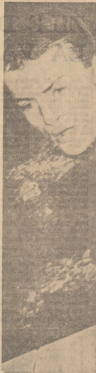
Vasile Costa și-a luat revanșa câștigând ieri proba de 100 m bras

Și în cealaltă probă de spate (100 m) am fost martorii unei