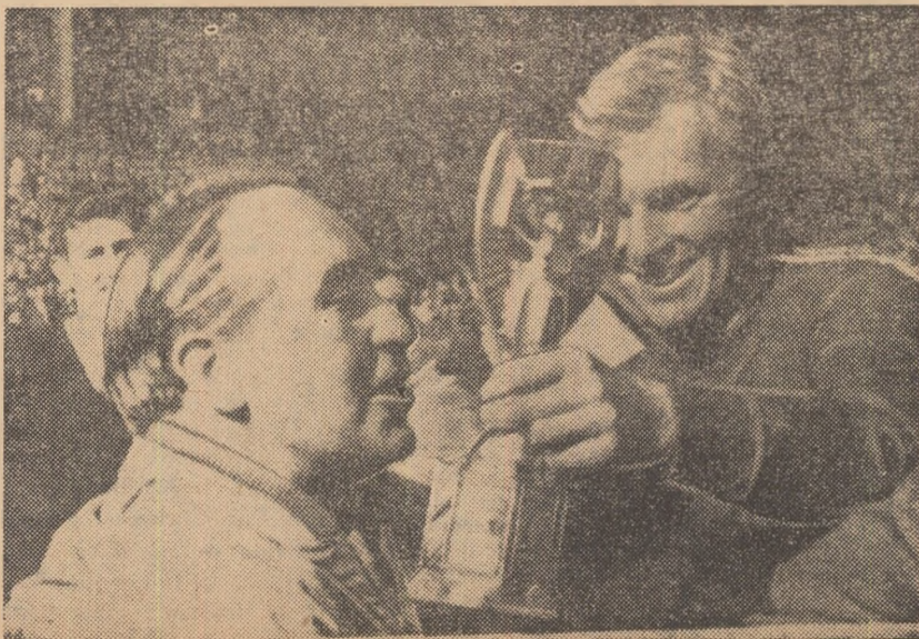
Antrenorul Ali Ramsey sărută cupa pe care i-o întinde Bobby Moore, căpitanul echipei engleze.