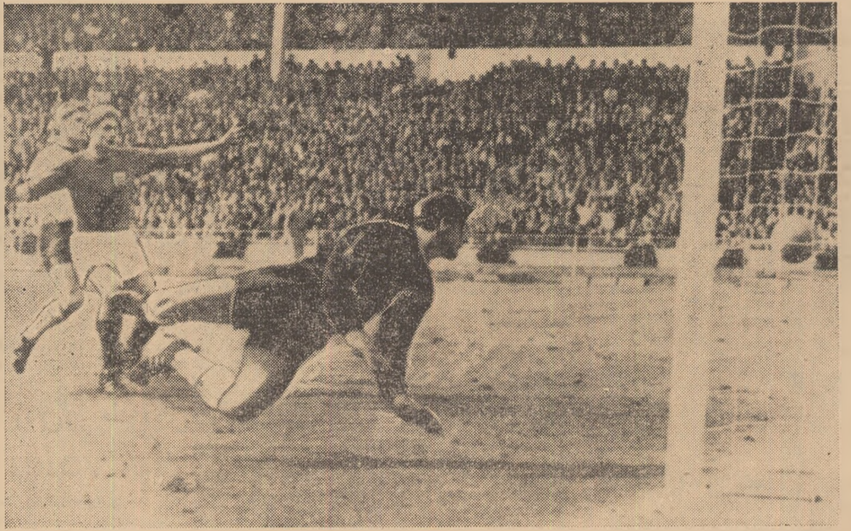
Al treilea gol al echipei engleze marcat de G. Hurst. În fotografie: Tilkowski privind mingea care va intra în plasă.

Prelungirile regulamentare supun la grea încercare pregătirea fizică a echipelor, fotbalistii englezi fiind evident superiori adversarilor lor din acest punct de vedere. Ritmul jocului e acum mai lent, ambele părți preferă deschiderile lungi. În min. 92, Ball (cel mai bun jucător englez în finala de sîmbătă) face o cursă lungă și trage puternic de la marginea careului, Tilkowski salvează cu dificultate în corner. Este apoi rîndul lui Hunt să tragă la poartă, dar șutul său de la 20 m este reținut. În min. 96 apărarea engleză este surprinsă mult prea în față și contraatacul foștilor campioni mondiali este foarte