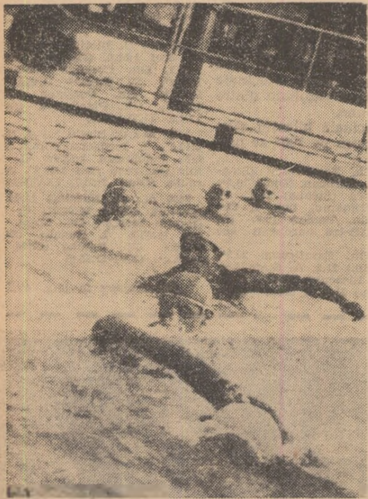
Fază din meciul S.S.E. nr. 2—Dinamo București

La strandul Tineretului din Capitală au început întrecerile turneului final al campionatului republican de polo pentru juniori. În urma întrecerilor zonale s-au calificat în această ultimă fază formațiile: S.S.E. 2, S.S.E. 1, Steaua și Dinamo din București C.S.M. și Politehnica din Cluj, Rapid Oradea și I.C.A. Arad.