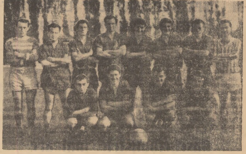
Echipea C.F.R. Timișoara — cîștigătoarea seriei Vest a categoriei C.