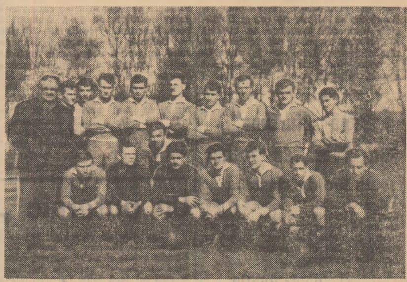
Echipea Unirea Dej — cîștigătoarea seriei Nord a categoriei C.

După terminarea primei părți a campionatului seriei Nord, Unirea Dej obținuse următoarele rezultate: 6 meciuri cîștigate, tot atîtea pierdute și un meci nul, acumulînd 13 puncte. În clasament ocupa un amenințător loc 10, la numai patru puncte de penultima clasată, dar la tot atîtea puncte de ocupanta primului loc Steaua roșie Salonta. Conducerea secției de fotbal a asociației a analizat comportarea echipei și a ajuns la concluzia că unii jucători sînt indisciplinați și că antrenorul cocoloșește lipsurile elevilor săi. Cu acest prilej s-au luat o serie de măsuri printre care și schimbarea vechiului antrenor cu Eutin Stepan. În primăvară, la reluarea campionatului, s-a constatat o îmbunătățire substanțială în jocul echipei. Timp de șase etape Unirea Dej nu a cunoscut