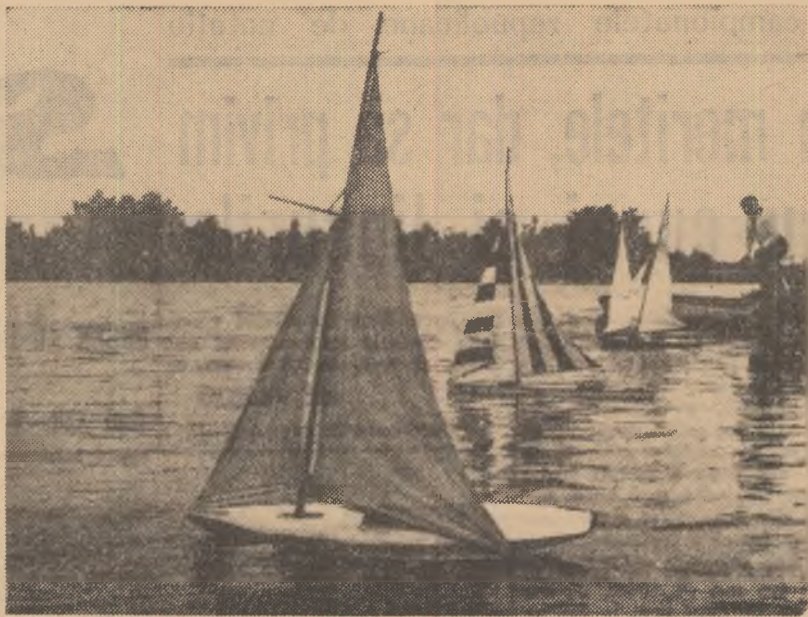
Velierile au prins vînt și înaintază în larg urmărite cu emoție de către constructorii lor