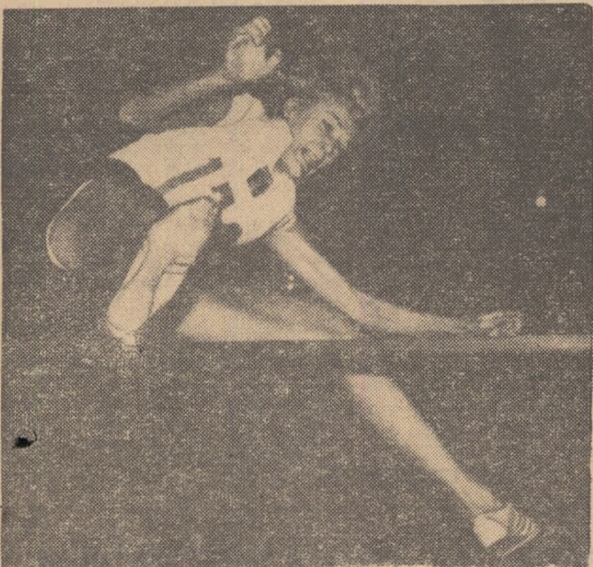
Iolanda Balaș se va strădui să adauge bogatului său paimares și cel de-al 15-lea titlu de campioană a țării