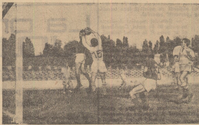
„Cupa de vară”, competițiile de tranziție între două sezoane, continuă duminică 7 august cînd debutează echipele din categoria A. În fotografie, o fază din partida Dinamo Victoria București — Tehnometal București (5-3), disputată în cadrul „Cupei de vară”.