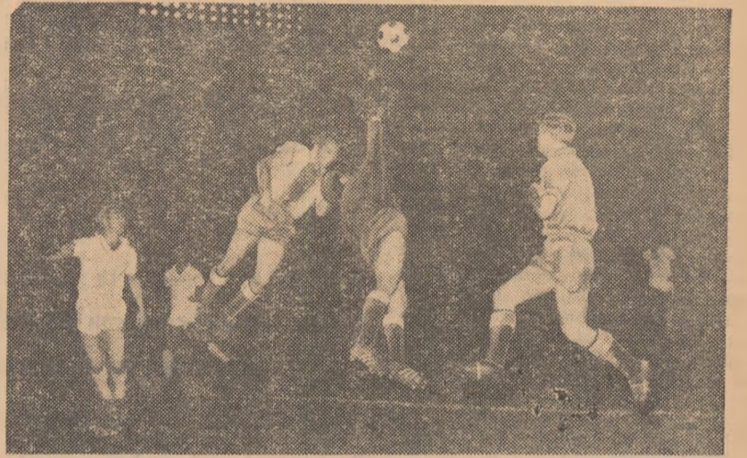
La prima evoluție în Capitală, S.K.A. Rostov a lăsat o bună impresie publicului. Fotbaliștii sovietici s-au impus prin jocul lor tehnic, în continuare muncă. Iată-i, în fotografie, apărându-se cu calm la unul din atacurile inițiate de jucătorii echipei Progresul.

— Prima ieșire pe teren a avut loc la începutul lunii iulie. Pînă în prezent avem 11 antrenamente în... picior. Planul de pregătire pe lunile iulie-august a fost împărțit în două: în prima etapă am pus accent pe dezvoltarea calităților fizice iar acum ponderea o au