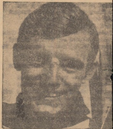
Schiorul Jean Claude Killy (Franța) — campion mondial la coborire

BORDEAUX. — Cu prilejul unui concurs de natație desfășurat la Bordeaux, o echipă feminină a Franței a stabilit un nou record al țării în proba de 4x100 m liber cu timpul de 4:13,4. Recordul european al acestei probe este de 4:12,0 și aparține echipei Olandei.