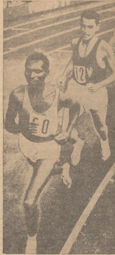
Kipchoge Keino (Kenia) conduce într-o cursă pe Ron Clarke (Australia)