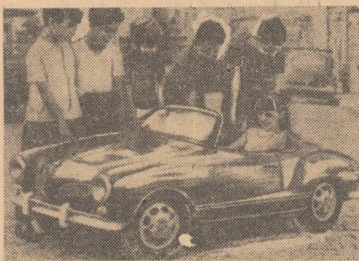
CEL mai mic automobil din lume! Pe străzile orașului Buenos Aires au început să-și facă din ce în ce mai des apariția aceste automobile liliputane, care constituie deliciul copiilor. Ele au un motor cu benzina de 3 C.P. și dezvoltă o viteză de 40 km/oră. Suficient ca din rîndurile micilor automobiliști să se ridice marii ași de mîine, demni urmași ai fostului campion mondial Juan Emanuel Fangio.

SE PARE că Universitatea din Kansas deține secretul... curselor-record pe distanțe medii. Jim Ryun, student al acestei universități, a stabilit un nou record mondial pe distanța de o milă. Un alt recordman al lumii pe această distanță, Glenn Cunningham a alergat cursa-record în 1934 tot în perioada studenției la Kansas. Wes Stantee, cel din urmă atlet american care a deținut recordul mondial la 1500 m a stabilit acest rezultat în 1953 cînd reprezenta culorile aceleiași universități.