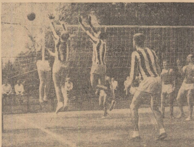
„Secvență” din finala voleibaliștilor, în care victoria a revenit jucătorilor de la I.O.R. (clubul sportiv Olimpia)