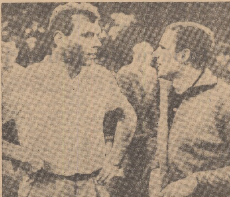
Doi recordmani mondiali se sfătuiesc: Jürgen May (în dreapta fotografiei), cel mai rapid om pe 1000 de metri și Peter Snell (Noua Zeelandă), actualul deținător al recordului lunii pe 800 m.

100 m: Irena Kirszenstein (Polonia) 200 m: Irena Kirszenstein (Polonia) 80 mg: Irina Press (URSS) lungime: Irena Kirszenstein (Polonia) înălțime: Iolanda Balaș (România) greutate: Tamara Press (URSS) disc: Tamara Press (URSS) suliță: Mihaela Pencș (România)