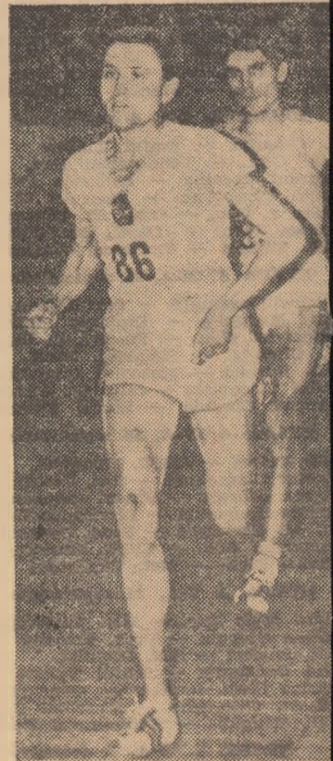
Michel Jazy este unul dintre cei buni alergători ai lumii. A câștigat cele europene, atletul francez își sura forțeta la 1500 și 5000 m.