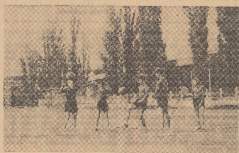
Pe malul Someșului, pe terenul din veșnicăta frumozului stadion orașenesc, în zilele vacanței se odănesc tinerii alușeni care încaj „partide” în toată legea

Miercuri seara, Dinamo București a jucat la Augsburg (R.F. Germană) cu echipa Schwaben care activează în campionatul regional (seria sud). Victoria a revenit fotbalistilor români cu 3-1 (2-1). Primul gol l-au marcat gazdele prin Sturm (min. 5), dar în continuare dinamoviștii au pus stăpînire pe joc, impunîndu-și superioritatea. Pircălab, care după cum remarcă corespondentul agenției S.I.D., a fost cel mai bun de pe teren, a egalat în min. 25 și apoi Frățilă a marcat scorul. După pauză (min. 71) Pircălab a stabilit scorul final, transformînd o lovitură de la 11 m acordată în urma unui hent în careu comis de un fundaș al gazdelor.