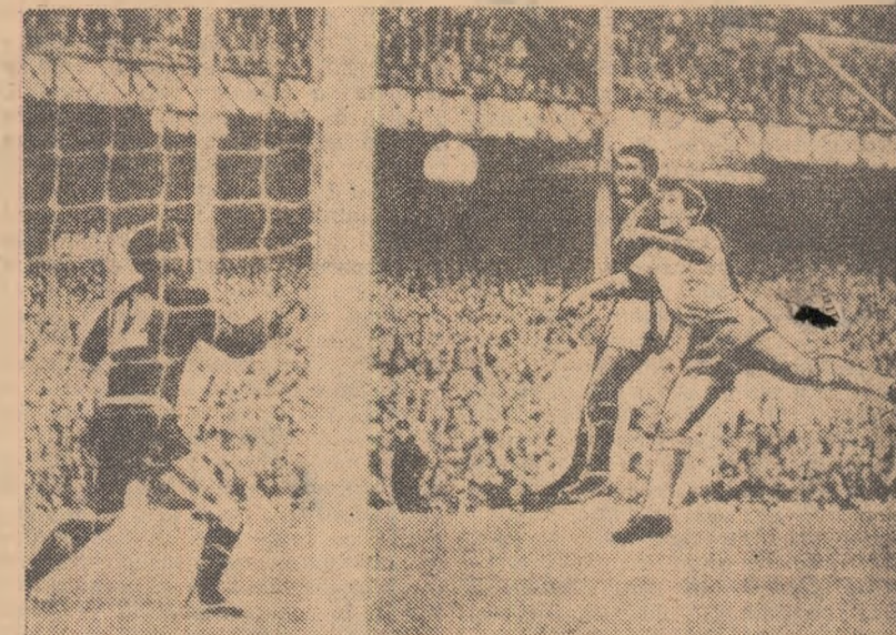
Cu toată intervenția brazilianului Orlando, celebrul Eusebio marchează doilea gol (cu capul) în poarta lui Munga. (Fază din meciul Portugalia—Brazilia 3—1!)

Iată configurația clasamentului după 14 runde: 1. Boris Spasski 9 puncte; 2. Fischer 8 puncte; 3—5. Larsen, Najdorf, Unzicker 7½ puncte; 6—7. Petrosian, Reshevski 7 puncte; 8. Portisch (Ungaria) 6½ puncte; 9. Donner 5½ puncte; 10. Ivkov 4½ puncte.