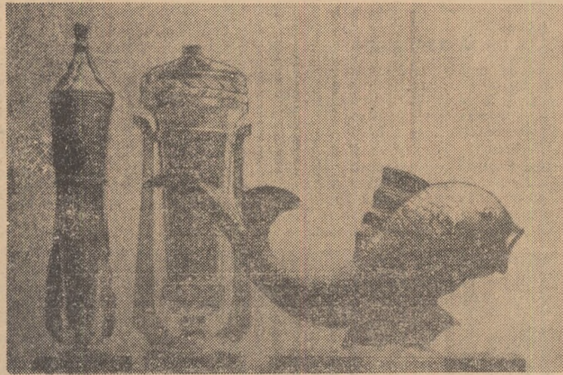
„Cupa Prieteniei” (mijloc) și celelalte trofee oferite de organizatori cu ocazia concursului internațional de pescuit sportiv din Polonia.

Câștigarea trofeului „Cupa Prieteniei” reprezintă un frumos succes al pescarilor sportivi din țara noastră.