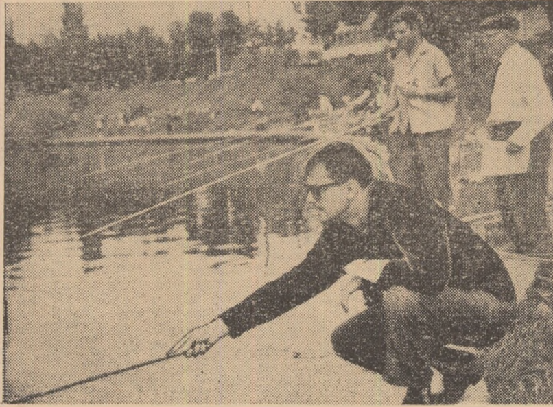
În plin... efort!