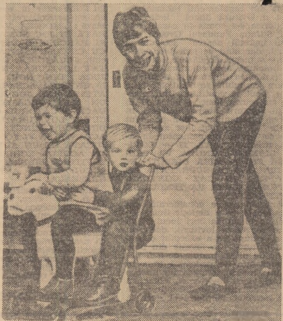
MARY RAND, una din „stelele” cele mai proeminente ale atletismului britanic, nu este numai o sportivă desăvîrșită, ci și o excelentă... mamă, așa cum ne convinge acest instantaneu de familie luat cu puțin înaintea plecării campioanei engleze spre Kingston, unde a cucerit (bineînțeles) primul loc la săritura în lungime.

echipe de fotbal, formate din pacienți, infirmieri și medici, au participat la un turneu dotat cu o „Cupă de vară”. Victoria a revenit echipei Institutului de psihiatrie „Paolo Pini” din Affori. După cele mai avansate studii de psihiatrie, această metodă care obișnuiește pe bolnavii mintali cu disciplina, constituie o primă treaptă în vindecare.