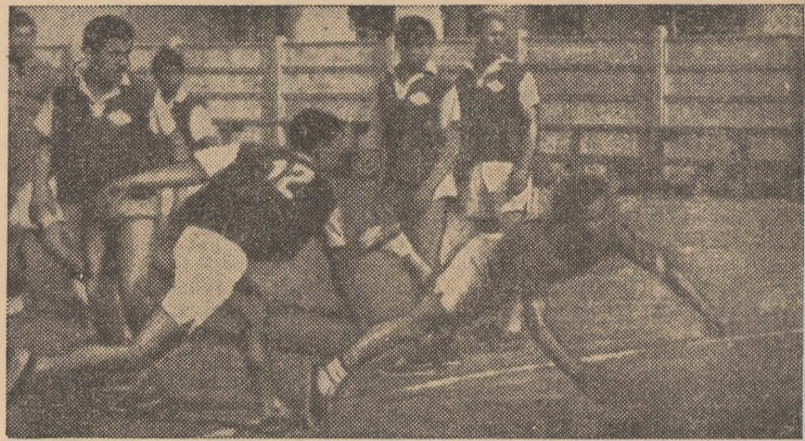
O imagine de la unul din numeroasele meciuri de handbal susținute de sportivii de la uzinele „23 August” din București. Se întrec handbalistii asociațiilor sportive Mecanica și Sculăria

BUCUREȘTI . Clubul sportiv Metalurgistul și comitetul U.T.C. de pe lîngă Uzinele „23 August” au întocmit pentru această perioadă un bogat program sportiv. În cadrul asociațiilor sportive din uzină au loc numeroase concursuri la fotbal, volei, handbal etc. Formația de handbal, care activează în campionatul de calificare al Capitalei a susținut un interesant meci la Oltenița cu echipa A.S. Comerțul pe care a întrecut-o cu 19—18 (10—8). Asociațiile sportive Sculărie, Mecanică și Motoare vor susține o serie de întîlniri cu reprezentativele altor asociații sportive din raion, ca de exemplu A.S. Republica, F.M.U.A.B. și cu cele din comunele Găneasa și Bălăceanca.