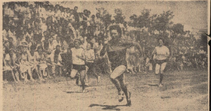
„Duminică cultural-sportivă” în comuna Putineiu (regiunea București). Ca în toate orașele și satele patriei, și aici sportul a ocupat un loc de cinste, mărturie fiind imaginea din timpul unei curse de 100 m

● ÎN ȚARA NOASTRĂ EXISTĂ ASTĂZI APROAPE 22.000 DE TERENURI DE SPORT, STADIOANE, SALI ȘI BAZINE ● 1.316.981 DE OAMENI AI MUNCII AU CUCERIT INSIGNA DE POLISPORTIV, DINTRE CARE PESTE 400.000 ÎN ULTIMUL AN ● LA CAMPIONATUL ASOCIAȚIEI SPORTIVE AU PARTICIPAT ANUL ACESTA 1.176.262 CONCURENȚI ● ÎN PRIMUL SEMESTRU AL ANULUI 1966 AU FOST ORGANIZATE 11.599 DE „DUMINICI CULTURAL-SPORTIVE”