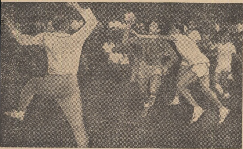
Acțiune din meciul selecționata București-selecționata orașului Berlin. Handbaliștii români inițiază un nou atac la poarta adversă

Duminică, tot la Dinamo, selecționata de tineret a Capitalei a dispus de reprezentativa Berlinului, după un joc echilibrat, cu 13-12 (6-6). Au înscris: Moldoveanu 3, Gunesch 2, Cristian 3, Mureșan 1, Cosma 4, respectiv Mihalk 2, Kertzsch 3, Zielke 2, Oneschkow 1, Bohnisch 2, Hildebrand 2. A arbitrat bine V. Sidea.