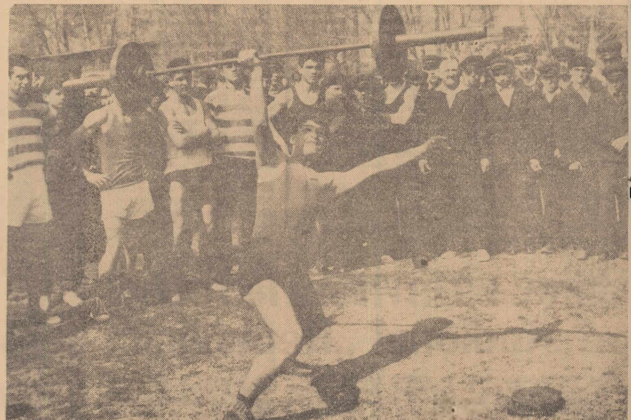
„Flăcăii se întrec”. Halterele au „prins” în jurul lor mulți amatori. În potcoava stadionului din Slatina își dau întâlnire tinerii iubitori de sport din oras