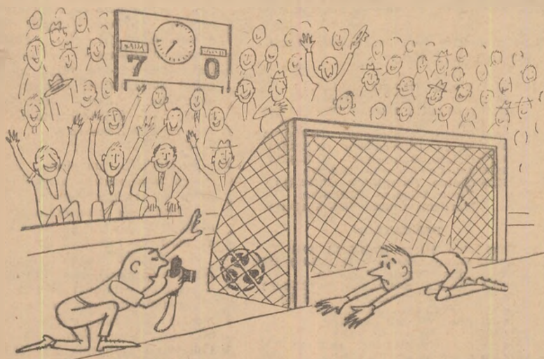
— Privirea mai sus și zîmbiți, vă rog.

Cele mai multe voturi — 23 la sută — le-a obținut Franz Beckenbauer. El a fost urmat de Seeler și Haller, în favoarea cărora s-au pronunțat 16 la sută din cei întrebați.