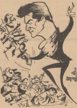
JEAN MARAIS văzut de Neagu Rădulescu

— Foarte puținul meu timp liber îl împart între cărți, muzică și sport. Pa-