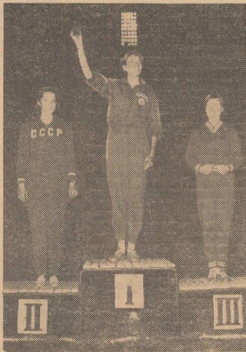
Iolanda Balaș, Taisia Cencik (U.R.S.S.) și Juroslava Rieda (Polonia) se vor întrece la „stacheta europenilor”, la Budapesta

Pe „Nepstadion”, din capitala Ungariei, vor începe marți după-amiază întrecerile din cadrul ediției a VIII-a a campionatelor europene de atletism, la care și-au anunțat participarea reprezentanți a 30 de țări, adică a tuturor celor care fac parte din comisia europeană de atletism.