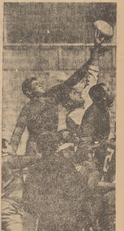
O tușă care ilustrează excelent inten- sitatea disputei (în alb dinamoviștii)

Celelalte rezultate ale etapei: CONSTRUCTORUL — GLORIA 3-3 (0-0); UNIVERSITATEA TI- MIȘOARA — PRECIZIA SACELE