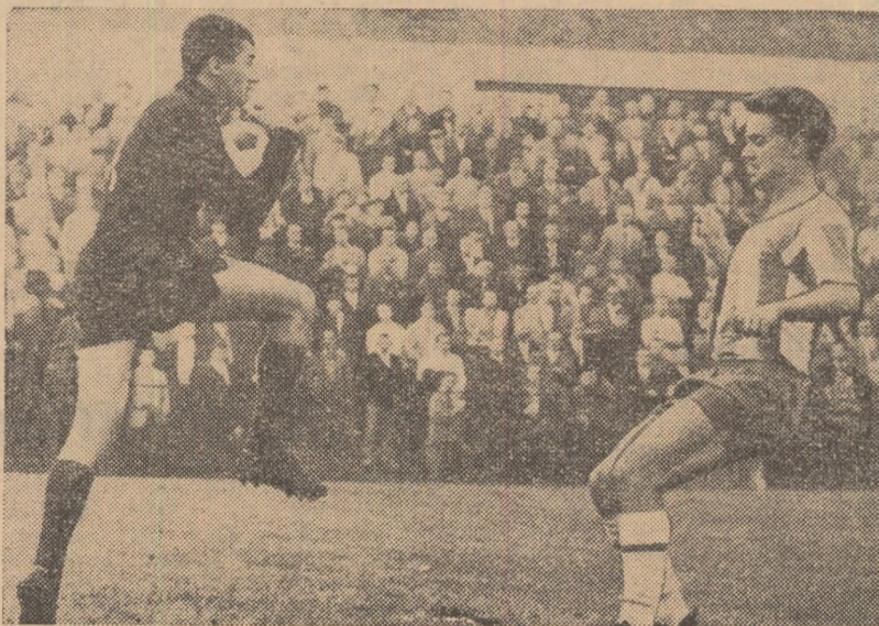
Datu prinde balonul sub privirile învinșii Krampitz. (Fază din meciul B.S.C. Hertha—Dinamo București).