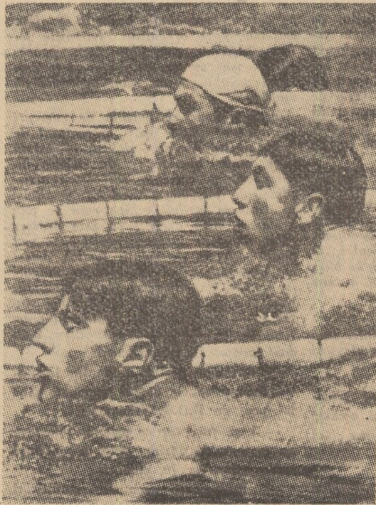
Concurs de inot in piscina de la Varna

LA VARNA funcționează în fiecare vară un centru de învățare a inotului, rezervat copiilor. Aici, în fiecare an, nu mai puțin de 12.000 de copii învață tainele acestui frumos și util sport. Cei mai buni dintre ei, pe categorii de vîrstă, sînt selecționați și își continuă antrenamentele și în timpul iernii. Astăzi, „Școala de natație de la Varna” — cum este denumit acest centru — este o adevărată pepinieră de inot din R.P. Bulgaria. Cursurile au loc zilnic, de dimineața pînă seara, și sînt conduse de 18 antrenori calificați și 53 de instructori. Cei mai