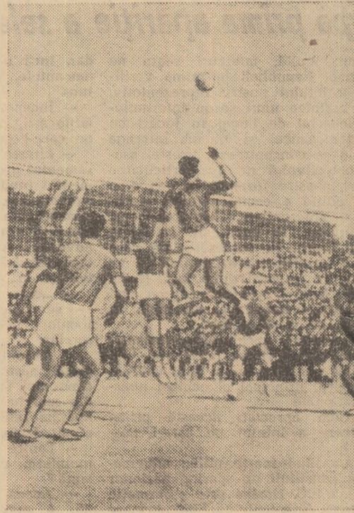
Reprezentativa de volei a R.P.D. Coreene în partidă internațională

● Una dintre cele mai populare discipline sportive din R.P.D. Coreeană este fotbalul. Practicat cu aceeași pasiune la orașe și la sate, el se bucură de pe-acum de o popularitate care se reflectă și în rapidele și importante succese obținute, nu numai pe plan intern, ci și pe plan internațional.