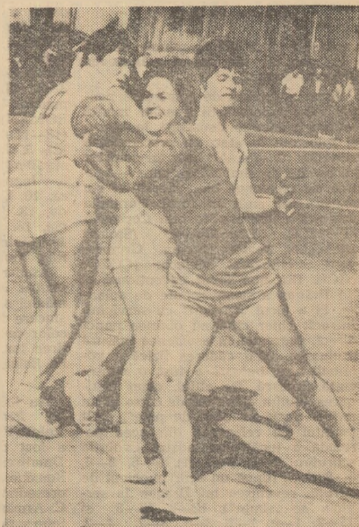
Moment de panică la poarta studenților: He- deșiu (Rapid) a scăpat în poziție clară! Din spate Szökő și Coman reușesc totuși s-o blocheze. Fază din meciul Rapid București — Universitatea București (10-7).

Metalul Copșa Mică — Faianța Si- ghișoara 1-0 (1-0) Progresul Reghin — Medicina Cluj 1-2 (0-0) Minerul Bihor — Olimpia Oradea 0-1 (0-1) Arieșul Turda — Recolta Carei 2-1 (1-0) Minerul Baia Sprie — Sătmăreana 2-0 (0-0) A. S. Aiud — Soda Ocna Mureș 3-1 (3-1) Steaua roșie Salonta — Chimica Tîrnăveni 1-1 (1-0)