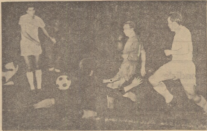
Progresul a deschis scorul...

Progresul preia apoi inițiativa, iar în minutul 18 Țarlungă trage la poartă. Un respinge defectuos și Oaidă reia în gol: 1-0. Un minut mai tirziu, apă-