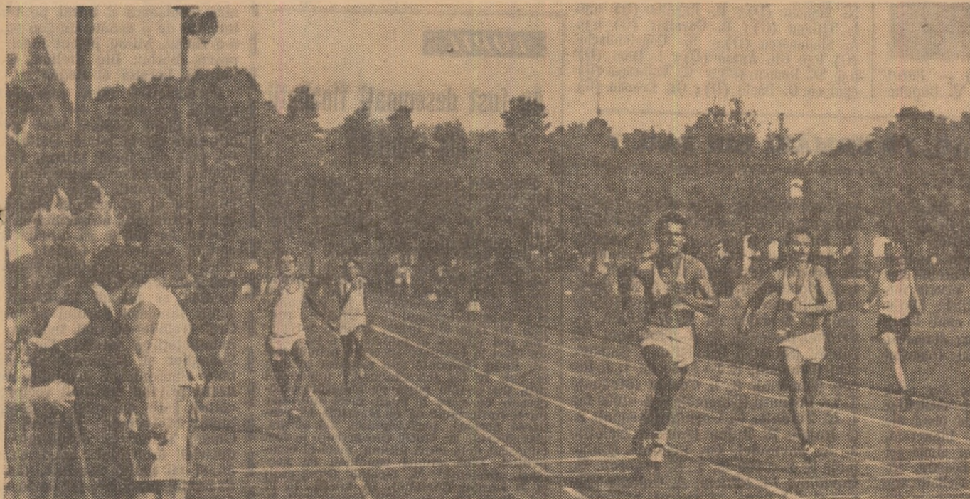
Duminică dimineață, stadionul Tineretului din Capitală a găzduit concursul athletic „Ziua alergărilor”. Iată o sosire într-una din numeroasele serii