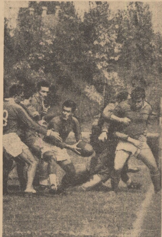
Luptă pentru balon în meciul Steaua — Farul Constanța

În ansamblu, jocul a plăcut prin mișcarea permanentă din teren. Păcat însă că două echipe fourth there (o notă bună în special pentru Progresul, care nu mai menține decât 3-4 jucători din garnitura anterior precedentă) nu se orientează mai mult către jocul pe treisferturi, de unde ar rezulta și spectacol și eficacitate sportivă. Aceasta constituie, desigur, o obligație pentru antrenorii respectivi.