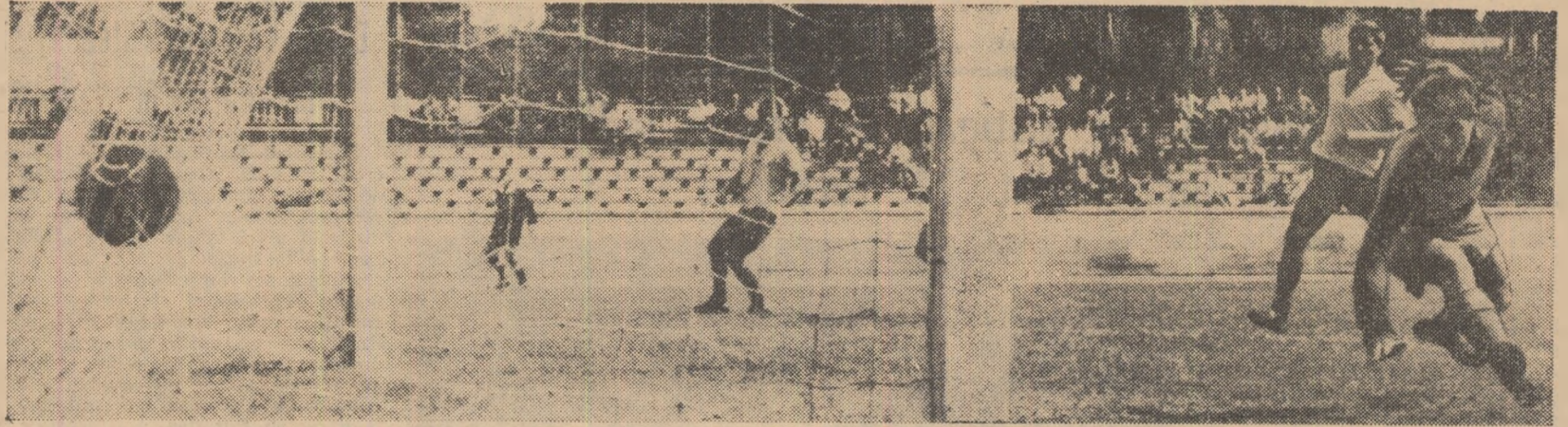
Al doilea gol al dinamoviștilor. Extrema stîngă, Dobrescu, care nu se vede în fotografie, a reluat precis în poartă centrarea lui Nuțu

Cluj): „Joc tipic de cam- namoviștii au manifestat o dorință de victorie și au o obțină datorită bunei lor Ei au avut o foarte bună în teren, au căutat drumul scurt spre poartă, prin ac- structive la care au colabo- mai mulți jucători. Se că echipa bucureșteană pe fapte mari. Dacă în imprima o și mai mare late acțiunilor pe poartă, fără îndoială, noi suc- avea un cuvânt greu în championat. În acest sens se mult mai mult de la Frățilă