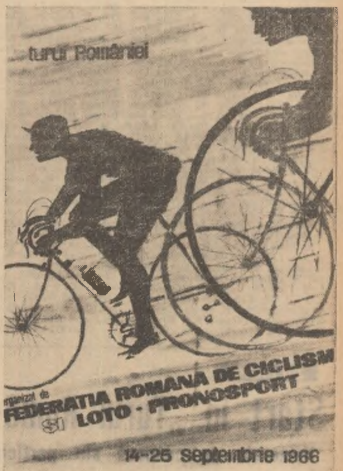
Federatia Romana de Ciclism și Loto - Pronosport 14-25 Septembrie 1966 Citiți în pag. a 2-a alte amănunte asupra desfășurării competiției

Etapa I a celei de a XV-a ediții a „Turului României” se desfășoară astăzi pe următorul traseu: plecarea oficială de pe bd. Dr. Petru Groza, apoi la treapta pe bd. Dr. Marinescu, la stînga pe șoseaua Cotroceni, în continuare pe bd. Armata Poporului, la stînga pe str. Vătafului, la dreapta pe str. Bujoreni, la stînga pe str. Buceșnești, la stînga pe bd. Ghencea, la stînga pe Drumul Sării, înainte pe strada Răzoare, la dreapta pe șoseaua Pandurilor, la stînga pe str. Dr. Reiner, la stînga pe bd. Dr. Marinescu. Această buclă va fi acoperită de 8 ori. În fiecare tur va avea loc un sprint pe bd. Dr. Marinescu. După efectuarea celui de al 9-lea tur din str. Dr. Reiner cicliștii vor merge înainte pe bd. Eroilor, înainte pe str. Știrbei Vodă, la stînga pe Calea Plevnei, la dreapta pe str. Ștefan Furtună, la stînga pe str. Baldovin Pircălabul, la stînga pe str. Gării, Piața Gării, bd. I. G. Duca, str. Dreaptă, la dreapta pe bd. N. Titulescu, Piața Victoriei, bd. Ilie Filintilie, șos. Ștefan cel Mare, la stînga pe Calea Floreasca, la dreapta pe str. Aviator Bănculescu — Velodromul Dinamo. Plecarea se dă la ora 14,15, iar sosirea va avea loc în jurul orei 17.