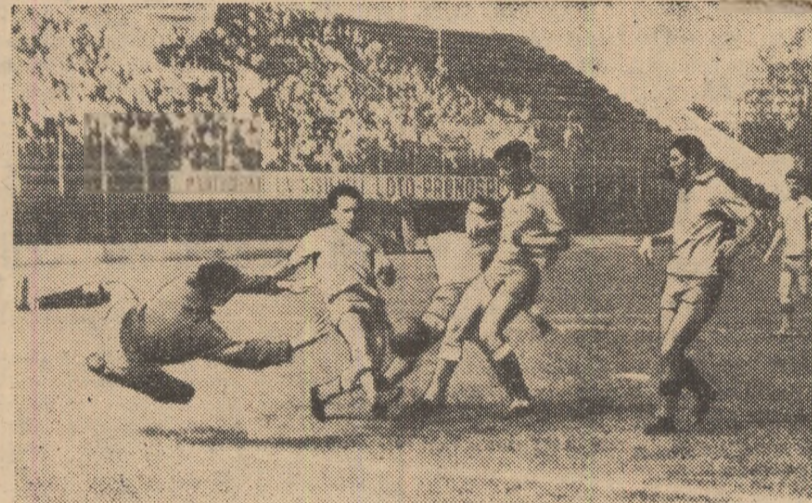
Portarul Ploeanu (Flacăra roșie) plonjează spectaculos. (Fază din partida Tehnometal București—Flacăra roșie București 3—2)

Performera seriei Vest a fost E- lectroputere Craiova, care a înregist- rat singura victorie în deplasare. Craiovenii au dominat cu autoritate și au fructificat toate ocaziile. De altfel, Electroputere, împreună cu in- vînsa sa — Progresul Strehai au