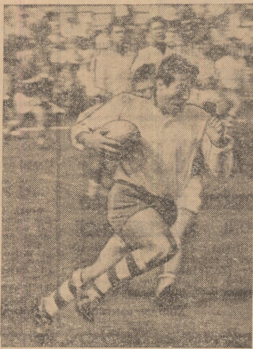
Fază din meciul de rugby Gloria—Grivița Roșie