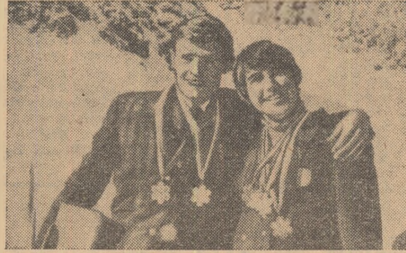
La campionatele mondiale de schi (probe alpine) de la Portillo, schiorii francezi au reușit un succes remarcabil. Iată doi dintre „așii” medaliați în Chile: Jean Claude Killy și Marielle Goitschel, care împreună au cucerit nu mai puțin de 5 medalii