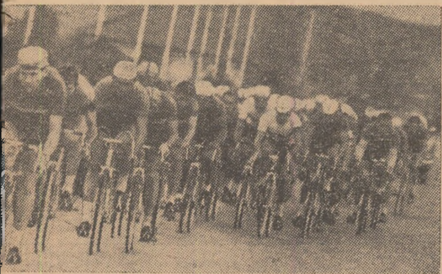
Aspect din etapa a VII-a pe ruta Tg. Mureș-Cluj.

chipa noastră campioană, Petrolul Pitești, va disputa primul joc în compania campioanei Angliei, formația F. C. Liverpool, în „Cupa campionilor europeni”. După cum se știe, primul joc va avea loc la Liverpool, iar cel de-al doilea la 12 octombrie la Pitești. Acesta din urmă va fi condus de trei arbitri din U.R.S.S.: Lukianov — la centru, Hodin și Zverev — la țușă.