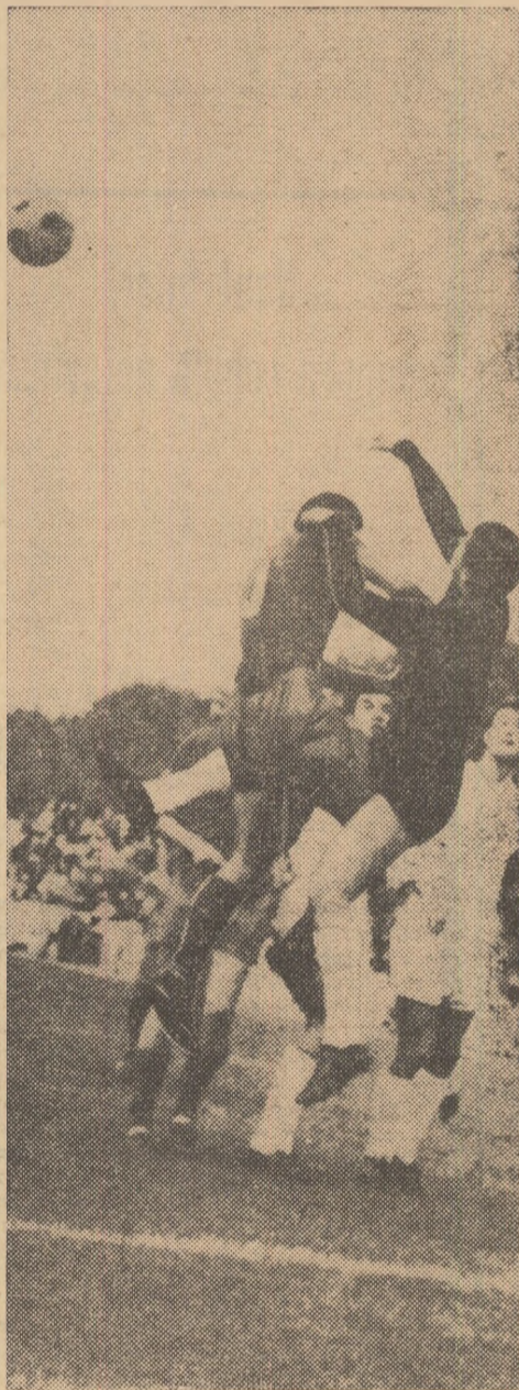
Duel aerian la poarta lui Pilec