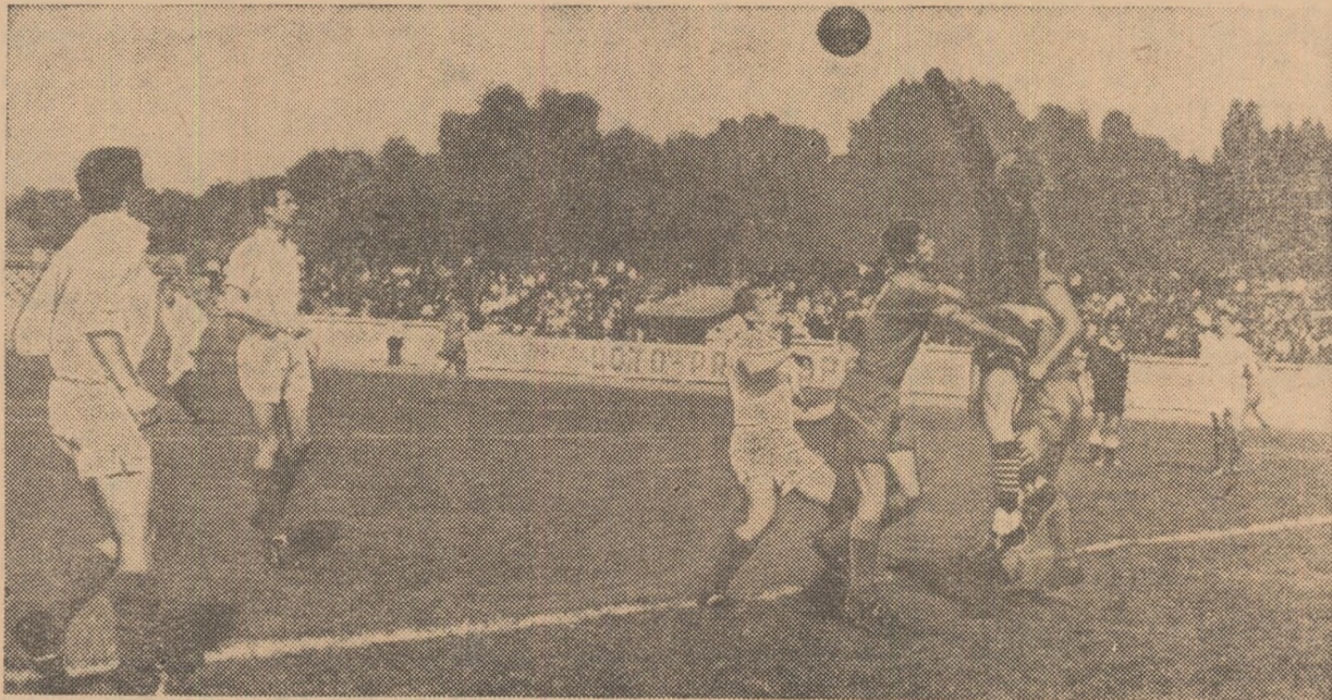
O fază din meciul Dinamo Victoria București—Poiana Cimpina

UNIREA DEJ—CLUJEANA (1—1). După începutul meciului se părea că lo-