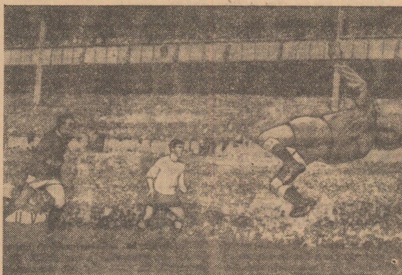
O săritură spectaculoasă a portarului Jennings de la Tottenham. Șutul lui Best (Manchester United) a fost puternic, dar Jennings a trimis balonul deasupra porții. În stînga se vede Denis Law. O fază din meciul Tottenham-Manchester United (2-1) din campionatul englez

— Wiener Sportklub 2-2, Austria Klagenfurt — Austria Viena 1-0, Schwarzweiss Bregenz — Grazer A.K. 2-1. În clasament, pe primele locuri, se află Rapid Viena și Vienna cu cîte 7 p.