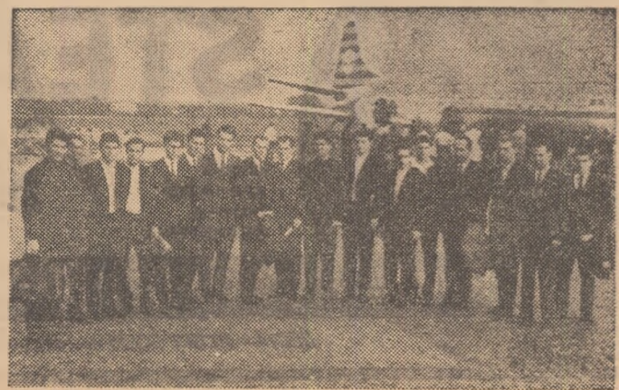
Aeroportul Băneasa. Echipa Petrolul Ploiești înainte plecării spre Liverpool (Amănunte în pag. a III-a)

Formația spaniolă F. C. Sevilla, care va întîlni miercuri pe Dinamo Pitești în „Cupa orașelor tîrguri”, a sosit aseară în Capitală. Echipa va fi alicătuată din următorii lot: Mutt, Rodri — portari, Victor, Felo, Achucarre — mijlocași, Oliveros, Dieguez, Lizarralde, Carbal, Pepl, Lora — atacanți. Antrenor: Barmaga. F. C. Sevilla va pleca la Pitești în cursul dimineții de azi.