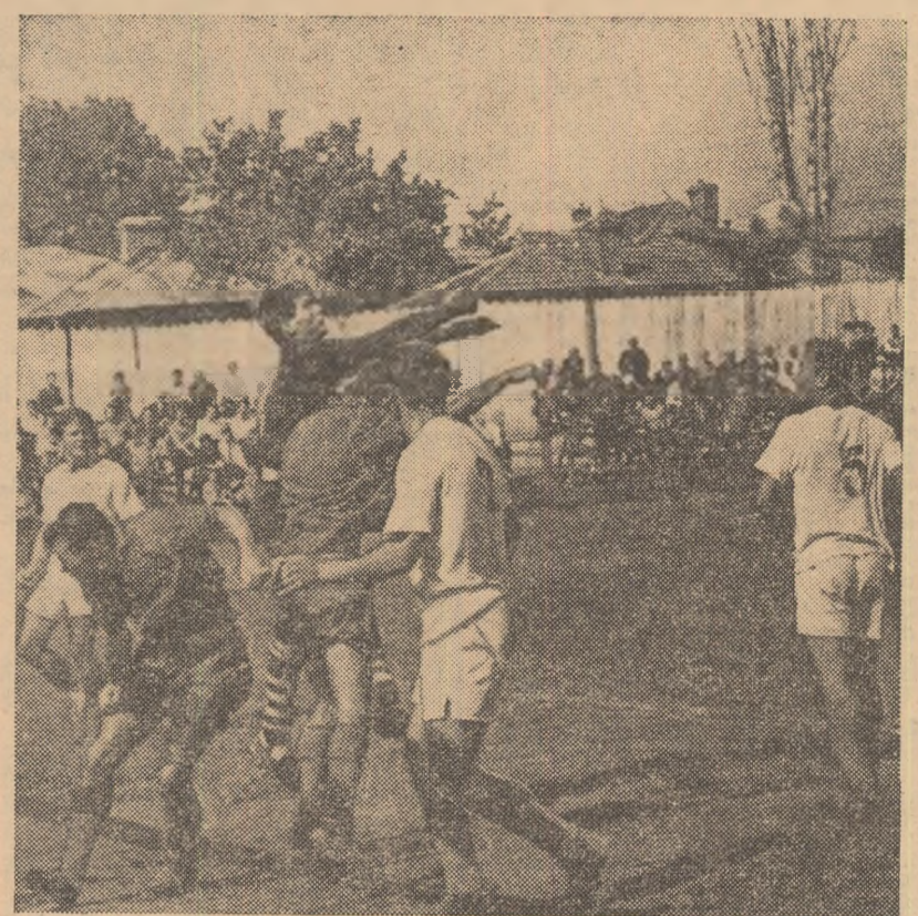
Apărătorii din Tîrgoviște (tricouri albe) fac eforturi vizibile spre a opri atacurile bucureștenilor (jază din meciul Flacăra roșie București—Metalul Tîrgoviște 2-2)