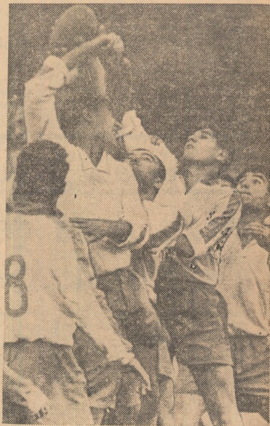
O frumoasă repunere din margine în meciul Dinamo — Precizia Săcele