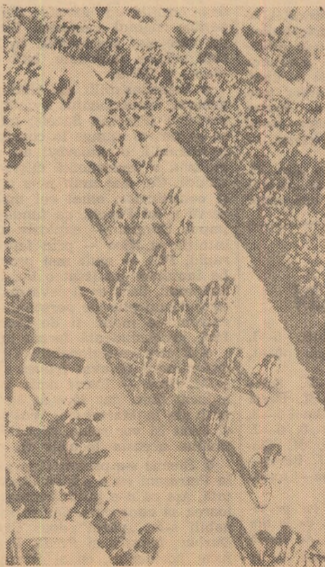
Oradea. Start festiv în etapa a IX-a a „Turului României”

Pentru astăzi ne-am propus să ne ocupăm de cîteva dintre aspectele ridicate de actuala ediție a „Turului României”. Vom sublinia în primul rînd faptul că ea a însemnat un mijloc deosebit de eficient de popularizare a sportului cu pedale. La Buzău, la Oradea și la Arad, în Orășul Gheorghe Gheorghiu-Dej și la Călimănești mi și mii de oameni i-au putut vedea pe rutierii despre care în general „aud” doar din presă, și-au putut da seama de calitățile lor, au putut aprecia frumusețea ciclismului. Această întrecere va stîrni în inimile multor tineri pasiunea pentru ciclism și va aduce