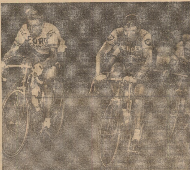
Jacques Anquetil (în stînga) a câștigat pentru a noua oară tradiționala competiție internațională „Marele premiu al națiunilor”, disputată pe distanța Aulfargis—Paris (72 km)

● În campionatul U.R.S.S. s-au înregistrat următoarele rezultate: Neftianik Baku — Zenit Leningrad 3—0; Pahtakor Tashkent — Torpedo Kutaisi 0—0; Kalrat Alma Ata — S.K.A. Rostov pe Don 1—1; Dinamo Tbilisi — Arpile Sovietelor Kulbișev 1—0; Șahtior Donețk — Lokomotiv Moscova 1—0; S.K.A. Odesa — Dinamo Minsk 1—1.