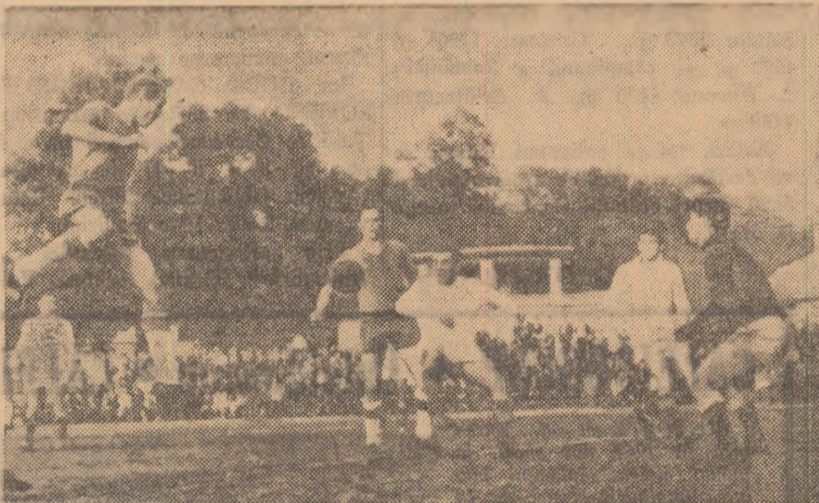
Fază din meciul Știința București—Siderurgistul disputat ieri în Capitală