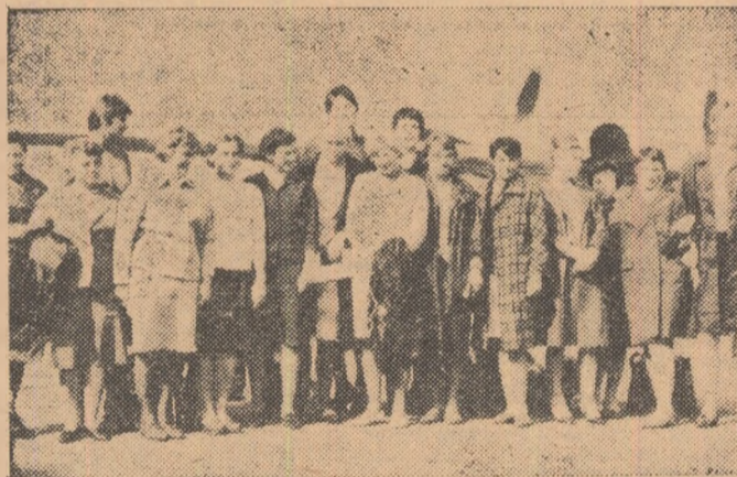
Pe aeroportul Băneasa, la câteva minute după sosirea baschetbalistelor sovietice, campioane mondiale și europene