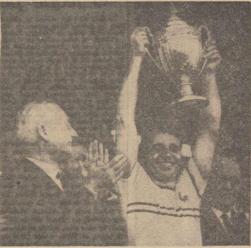
Căpitanul echipei R. C. Strasbourg purtînd mult rînditul trofeu — Cupa Franței — la sfîrșitul meciului R. C. Strasbourg — Nantes (1—0).