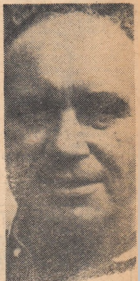
Alf Ramsey, antrenorul echipei Angliei, campion mondial.

MOSCOVA, 30 (Agerpres). În clamentul campionatului de fotbal al U.R.S.S., continuă să conducă Dinamo Kiev cu 43 de puncte din 22 de jocuri, urmată de T.S.K.A. Moscova cu 36 de puncte din 25 de meciuri și Torpedo Moscova cu 35 de puncte din 28 de jocuri.