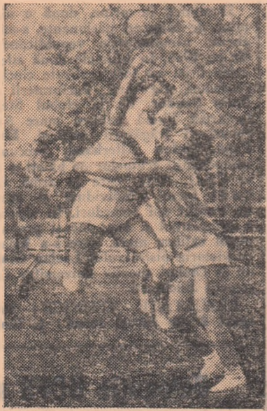
Fază din meciul Conecția București—Progresul București. Un atac al Conecției, finalizat de Zamfirache, nu și va atinge însă ținta...

FEMININ, SERIA I. Universitatea Timișoara—Rapid Buc. 8-5 (5-2). Derbiul campionatului feminin nu a dezamăgit așteptările. Ambele formații au practicat un handbal curat, de un ridicat nivel tehnic. Dorind să-și consolideze poziția fruntașă în clasament, studentele au început jocul într-un ritm foarte viu. Replica oaspetelor nu s-a lăsat așteptată. Treptat însă, pregătirea fizică superioară a echipei locale și-a spus cuvântul și Universitatea a obținut până la sfârșit o victorie pe deplin meritată. A arbitrat cu scăpări V. Reissner — Sibiu. (Ion Stan — coresp.) Liceul nr. 4 Timișoara—Mureșul Tg. Mureș 12-9 (6-2). Elevele și-au asigurat victoria în prima repriză. După pauză jocul a fost ceva mai echilibrat, însă handbalistele din Tg. Mureș nu au reușit să refacă din handicap. (Ion Ciocan—coresp.) Rulmentul Brașov—Universitatea București 6-10 (2-4). Organizându-și jocul mai bine și având un atac mai decis, studentele au obținut o victorie prețioasă. Lipsită de o pregătire fizică bună, echipa brașoveană nu a putut da un randament la nivelul