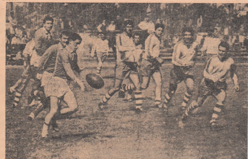
Wusek (Grivița Roșie), unul dintre selecționabilii care vor evolua astăzi în jocul de verificare de pe stadionul Republicii, gata să intercepteze balonul.

Pentru restul jucătorilor — încă rezerve.