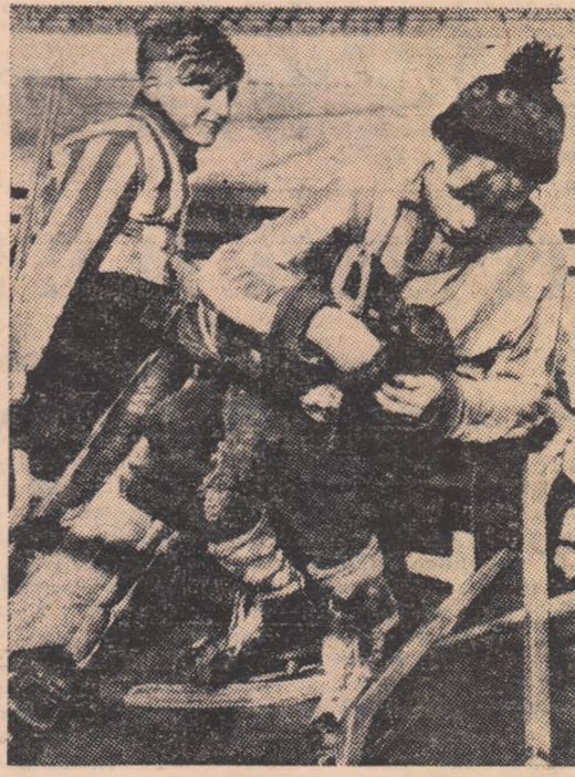
Gata pentru noul sezon de hochei pe gheață. Acești tineri hocheiști ai unei echipe din orașul Dresda se află în toată pregătirilor. Mai sînt puține zile pînă la un nou start în campionatul de juniori al R. D. Germane.