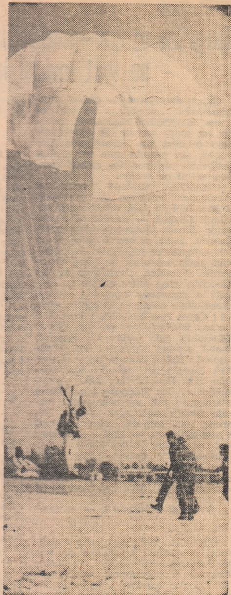
Spre punctul de aterizare...