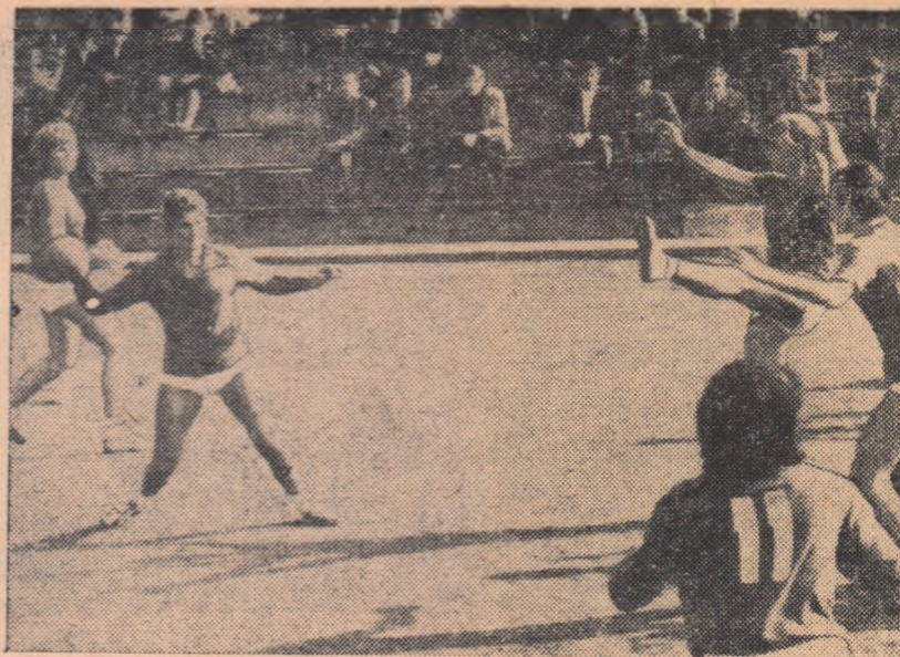
Handbalistele de la Liceul nr. 4 din Timișoara încearcă să străpungă apărarea formației Progresul București