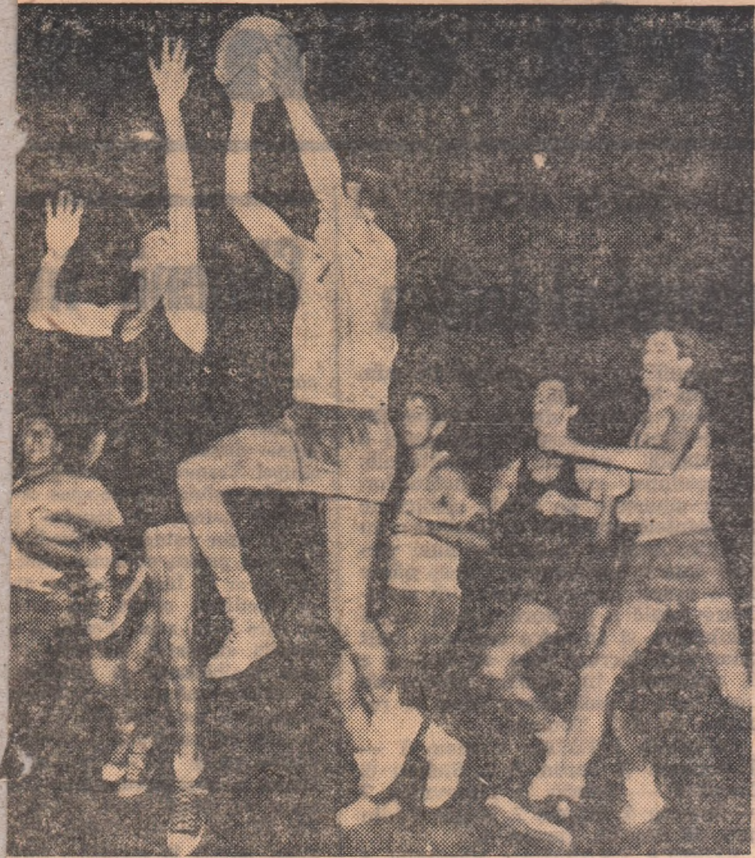
a sărit și aruncă la coș, în vreme ce Kun nu-l mai poate împiedica. Fază din meciul Dinamo București — Universitatea Cluj