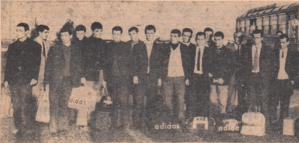
Fotbaliștii bulgari la sosirea în Capitală