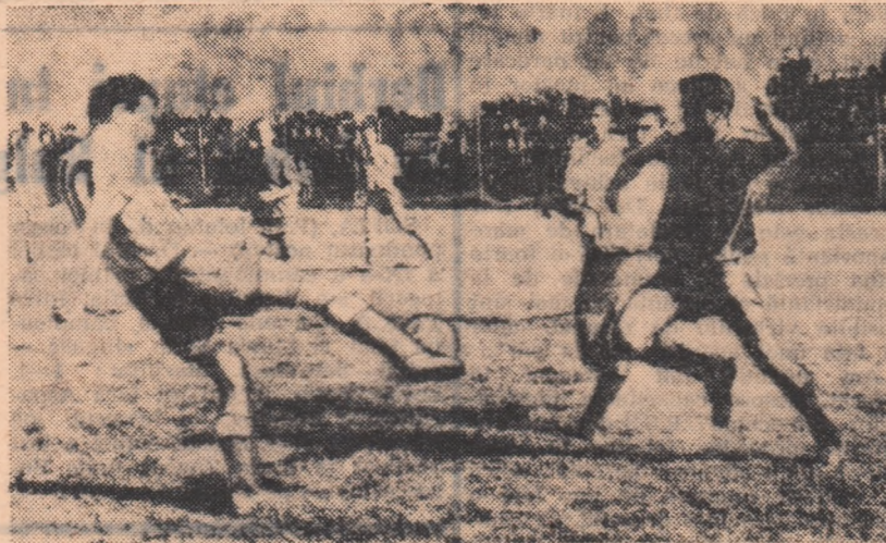
Un nou atac bucureștean respins de apărătorii oaspeți. (Fază din meciul Flacăra roșie București — Ș. N. Oltenița 1-2)