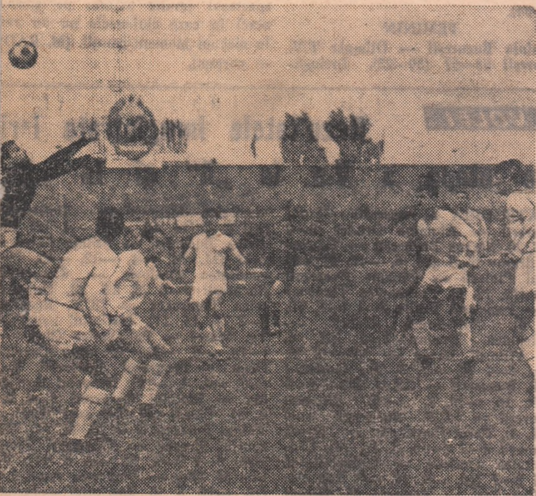
lovadă elocventă a modului în care s-a apărut simbată, în meciul cu Progresul, echipa Steagul roșu: șase brașoveni pe cîțiva metri pătrați în fața propriei porți!